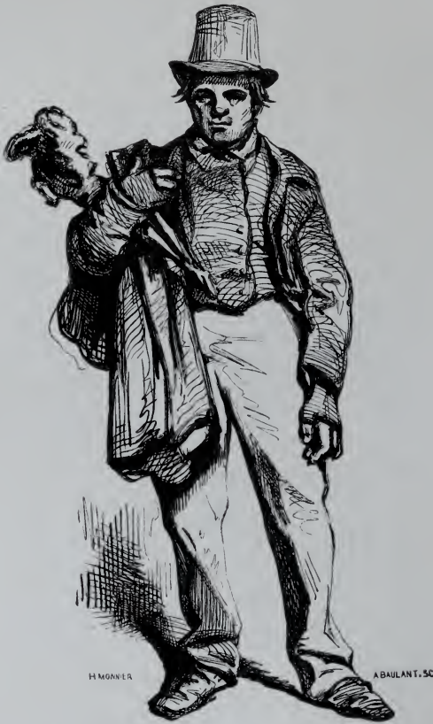
Le Marchand de Peaux de Lapins.